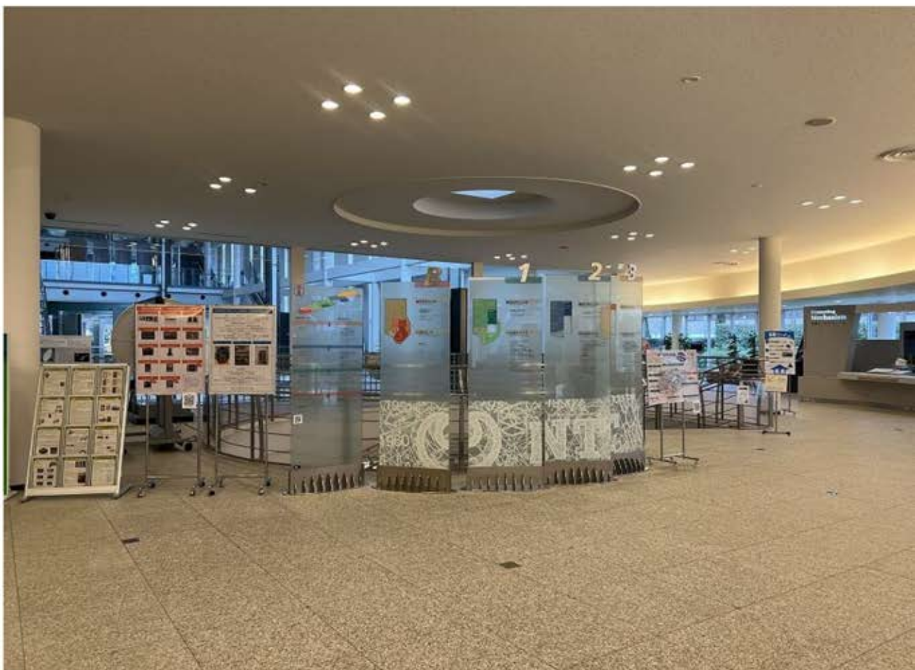
エントランス風景