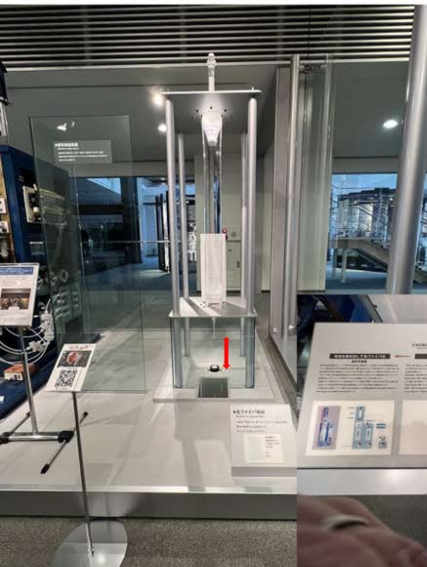
光ファイバーの制作模型