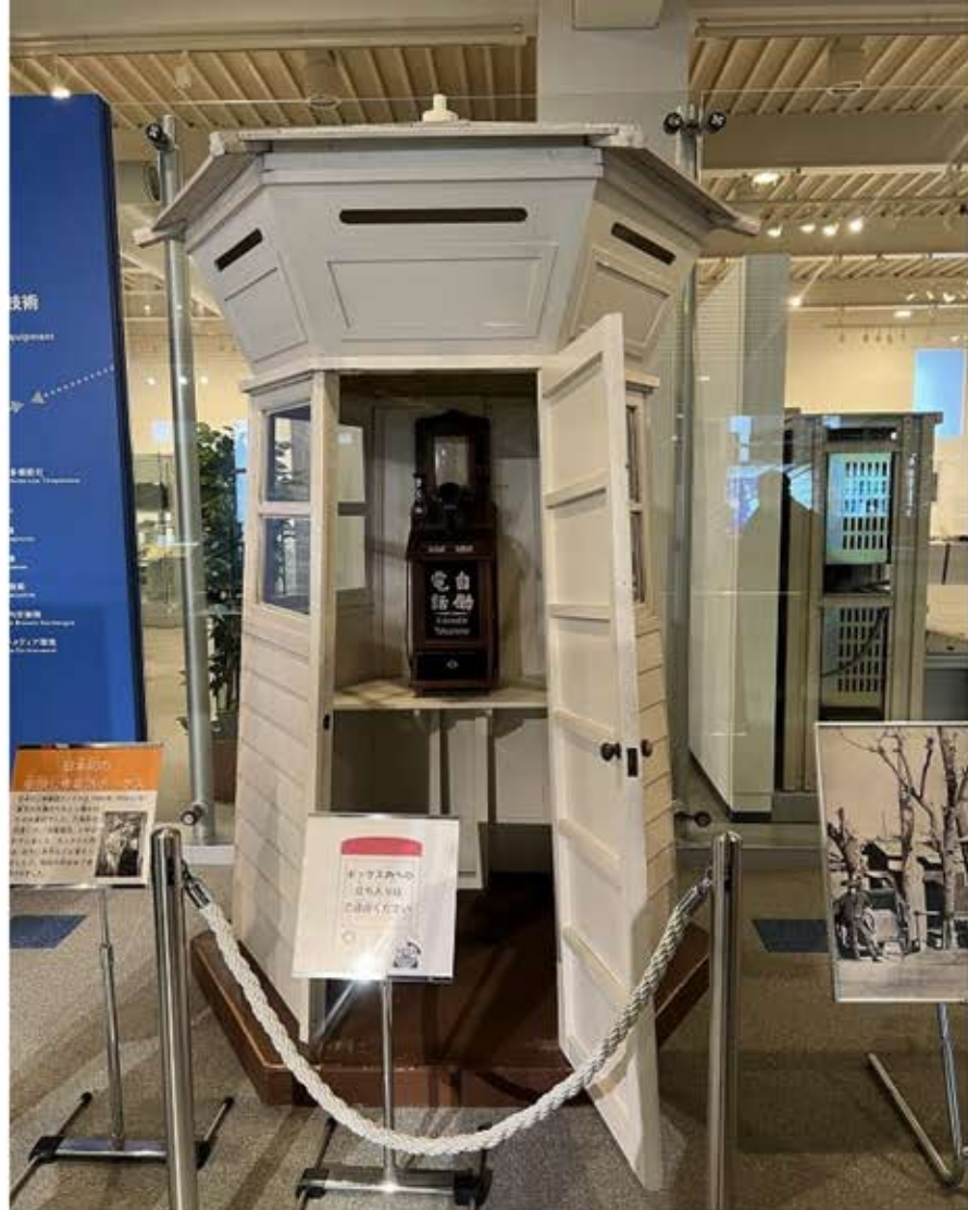
日本初の公衆電話BOX(自動電話と訳された)