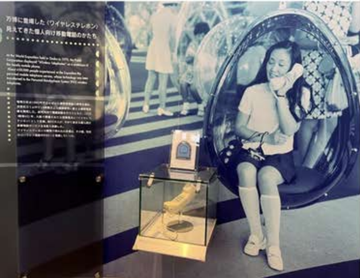
無線電話の広告と電話機(右)