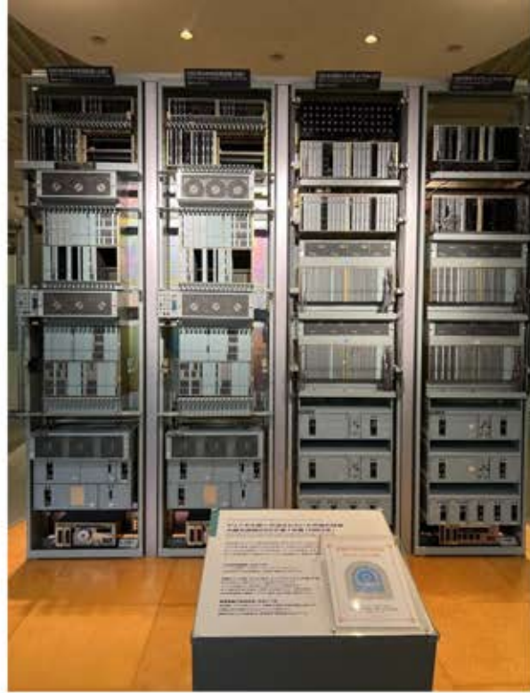
配電盤の裏側の変遷