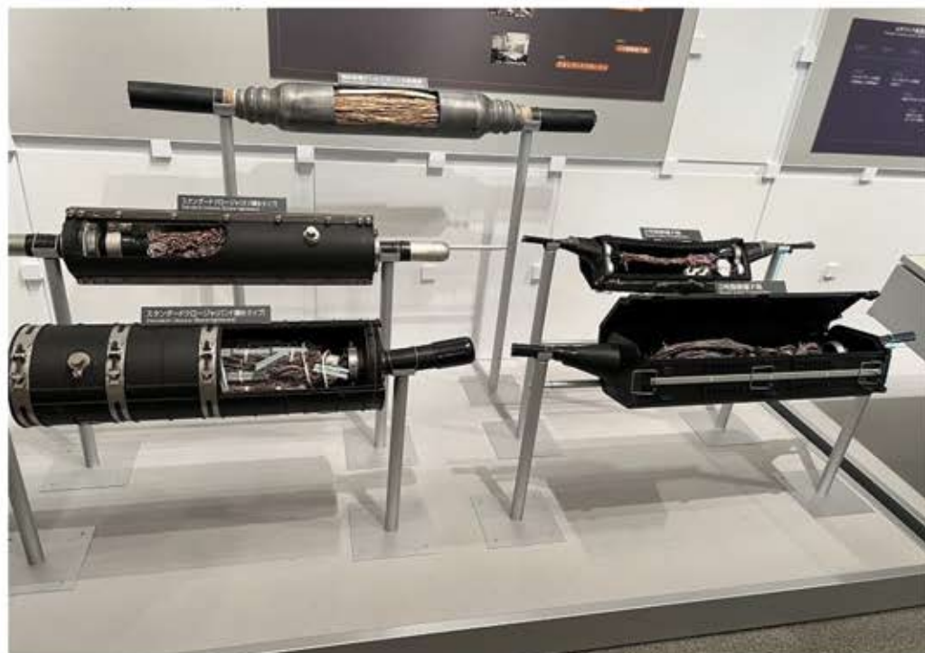
現在も活躍している電話線の接続部分の変遷(初期は湿気を防ぐためワラや紙が入れてある)