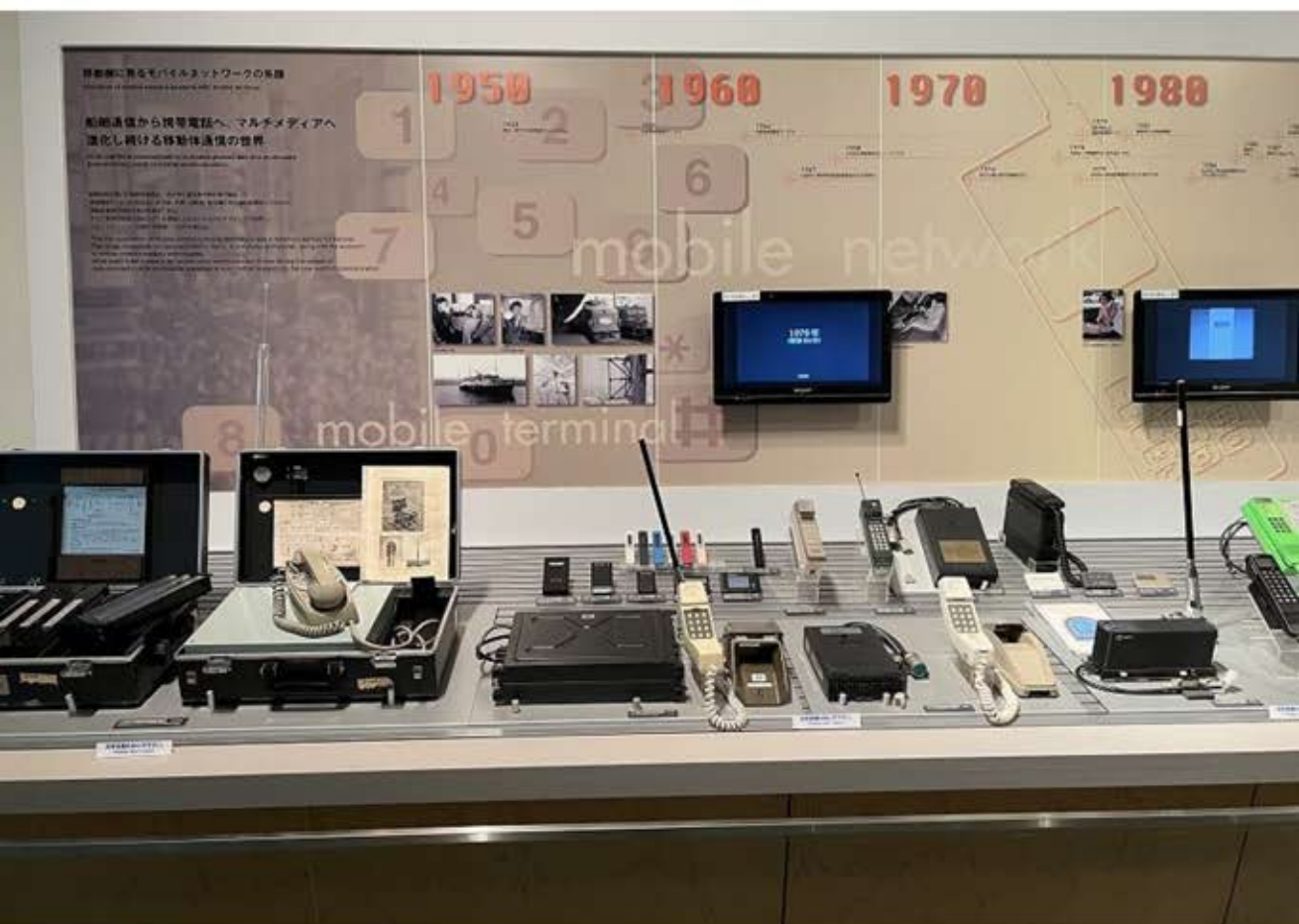
自動車のバッテリーを利用した自動車電話から携帯電話の変遷