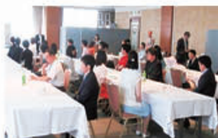
パーティでは 1対1の 自己紹介タイムも