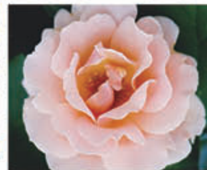
写真は イメージです