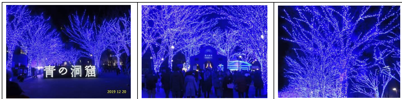
青の洞窟 SHIBUYA 2019

★ 忘年会が終わったのが午後 5 時。既に日はとつぷりと暮れて外は真っ暗になっていたが、時間はまだ早い。そこで有志 8 人は「青の洞窟 SHIBUYA」のイルミネーションを見に行くことにした。原宿駅から代々木公園に行くと、NHK の前のケヤキ並木は青一色の光でライトアップされ、実に幻想的な光景である。2019 年の散策の会の最後を飾るにふさわしい場所であった。