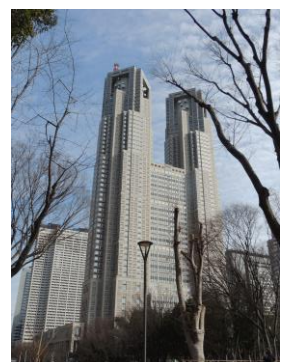
新宿駅の反対側から見た 東京都庁