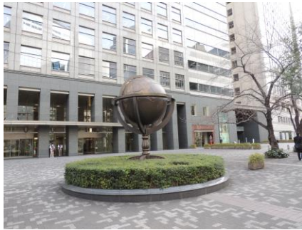
新宿文化クイントビル