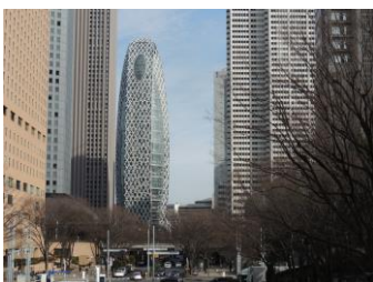
モード学園コクーンタワー