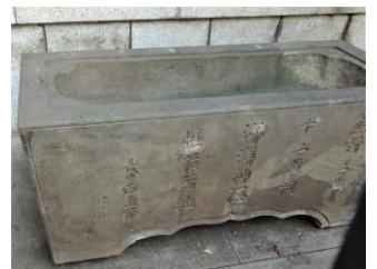
太田南畝（蜀山人）の書による銘文が刻まれた水鉢